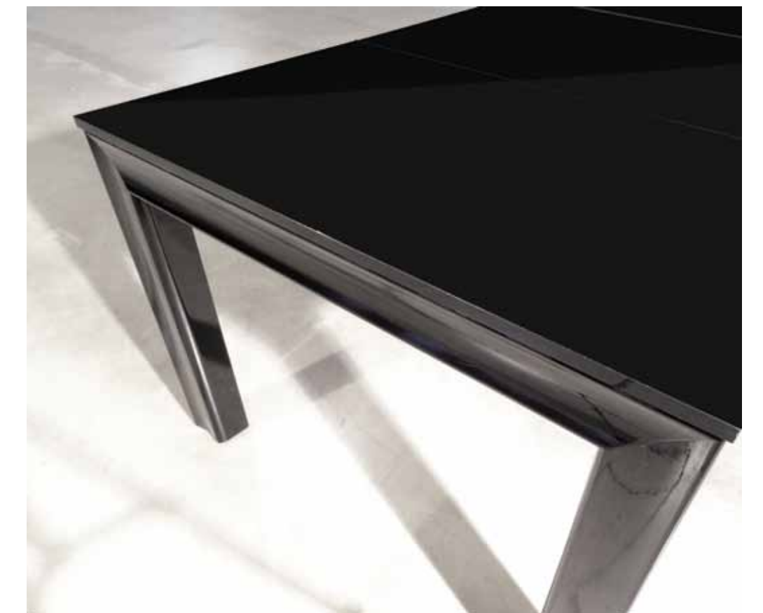
Le prolunghe in legno laccato lucido nero o avorio sono agganciate all'interno del tavolo su apposito vassoio rivestito in morbido feltro protettivo. The black or ivory extensions are stored and attached inside the table over the alluminium tray which is covered with soft felt to protect the surface of the extensions. Прочный алюминиевый раздвижной механизм и две ноги из массива дерева окрашены глянцевым лаком.